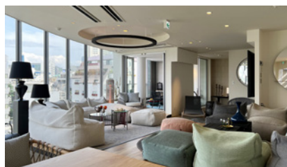
Terior 東京都渋谷区神宮前 3-35-1 5F/6F