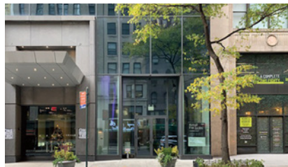
AREA New York 2023年秋オープン予定