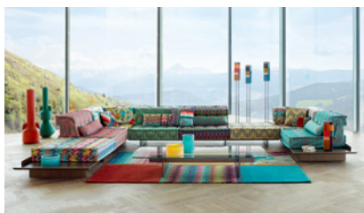
Roche Bobois Isetan Shinjuku 東京都新宿区新宿 3-14-1 伊勢丹新宿店本館 5F