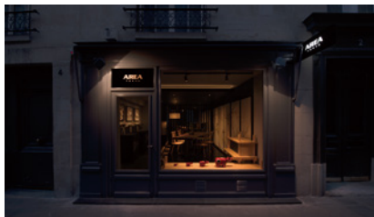
AREA Paris 4 rue de l'Université 75007 Paris FRANCE