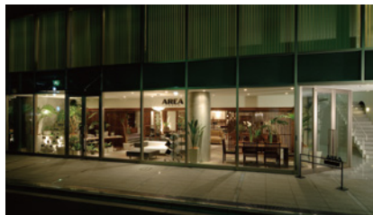
AREA Tokyo 東京都港区北青山 2-10-28 1F AREA Osaka Office 大阪府大阪市中央区平野町 2-2-13 5F

AREAは海外へ向けて、Roche Boboisは日本国内へ向けて、新たなショップの展開を行っていきます。