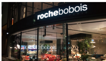
Roche Bobois TOKYO 東京都渋谷区神宮前 3-35-1 1F/2F